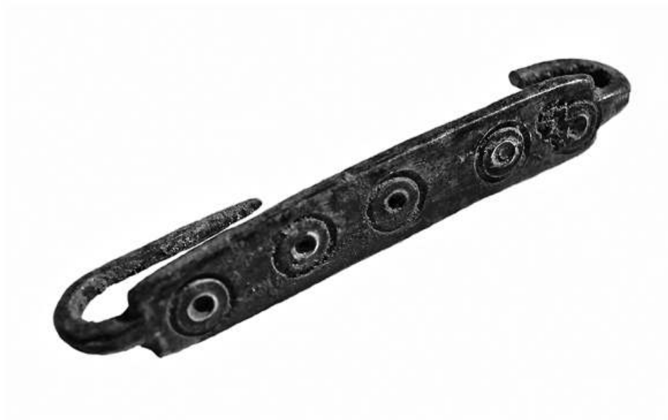
Auteur(s) : Borgard, Philippe.