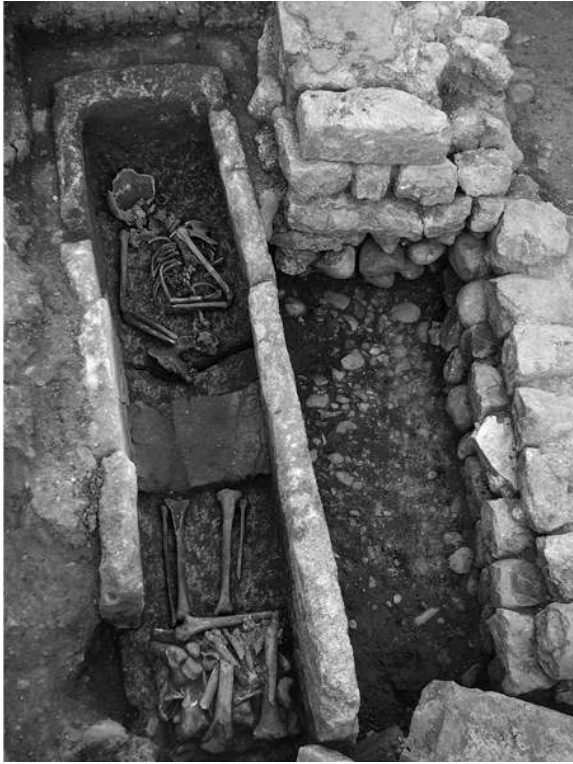
Auteur(s) : Borgard, Philippe. Crédits : ADLFI (2007)